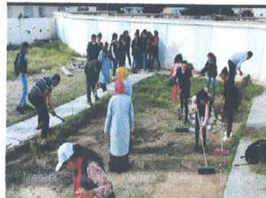
الصورة 07: حملة لتنظيف المؤسسة