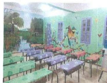
الصورة 06: قسم نظيف وجميل