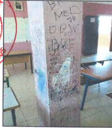
الصورة 03: جدران مكتوب عليها