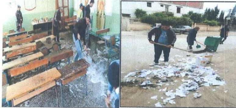
الصورة 05: حملة تنظيف الأقسام